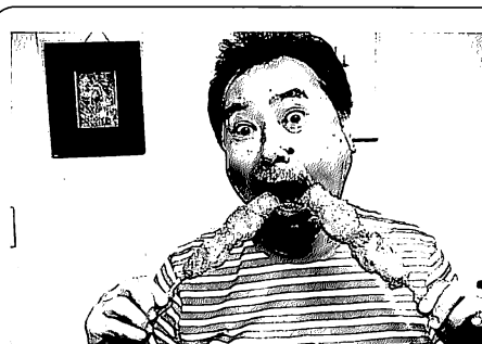
串カツ二刀流で満面の笑み 一本は「カラシ+ウスターソース」で、もう一本は「どるソース」でいただきます。