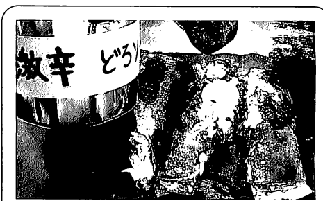
高砂の「つくし」の「にくてん」 エキスが凝縮したどろソースで超美味。一口食べるとドドッと汗が噴き出します。クセになる「にくてん」とどろソース」のコンビ。

一般的にソースといえばウスターソース。これは、イギリス中央部にあるウスター市で生まれた。19世紀初期にウスター市に住む節約家のおばちゃんか、余った野菜や果物を捨てずに何かに利用できないかと知恵を絞り、コショウ、唐辛子などを入れて貯蔵したところ、トロリとしたソースができ、舐めてみると「うまい!」。これがウスターソースの誕生である。