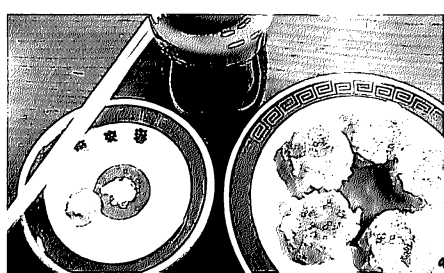
姫路名物「東来春」のシューマイ ほとんどのお客さんがこのシューマイを食べる。もちろんソースで。東来春にはお醤油は置いていない。(店員さんがイチイチ聞いてくれるけどね)

そもそも、関西にはイカリ、オリバーなど300社もの地ソース会社があり(驚!)、「阪神ソース」(神戸市)が大正年間に行ったパンフレットには、ソースに合うおすすめ料理として「天ぷら」が載っているのだ。